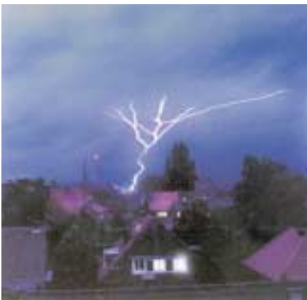
Gewitter mit Blitzeinschlag

Schäden durch Überspannung kann selbst eine intakte Blitzschutzanlage nicht verhindern. Ohne zusätzliche Schutzrichtung reicht ein Treffer oder ein Blitzeinschlag in der unmittelbaren Nähe und Ihr TV-Gerät hat erst mal Sendepause, die Waschmaschine ist kaputt, die Festplatte des PC zerstört, Ihr Telefon tot...!